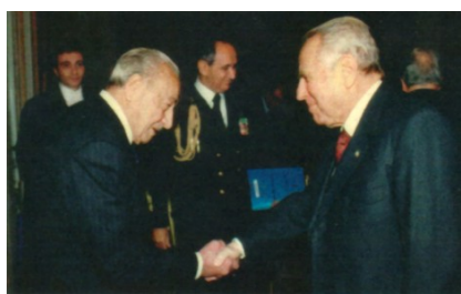
Quirinale - Roma 16 dicembre 2002 Consegna del libro "La scelta" al Presidente Carlo Azeglio Ciampi

la riva fu arrestato dai tedeschi che (nel mare aveva perso i pochi vestiti che indossava) nel vederlo passare le donne del posto gli gettavano senza farsi vedere dai tedeschi gli indumenti intimi. Morto a San Pellegrino Terme dove si era trasferito dopo il matrimonio il 26/10/2012. (OP)