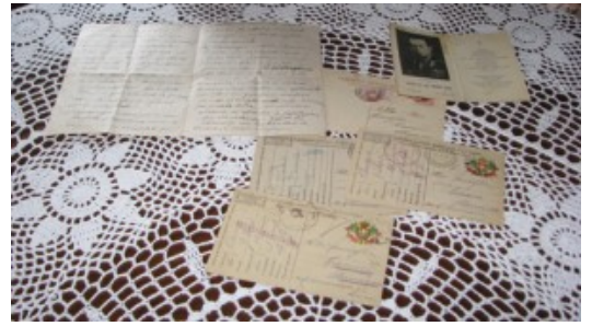
La corrispondenza di Canesi